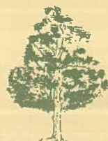
FAGUS SYLVATICA (Faggio)

"sviluppare la tutela, tutelare lo sviluppo .."